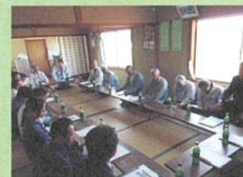
それぞれが抱えている築地松への思いを共有しました。

その後の意見交換では、参加者一人ひとりが安全対策や陰手刈り、築地松景観などへの思いを語り合いました。