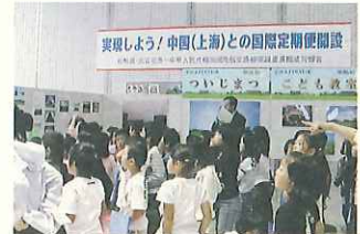
「質問です!なぜ、ついじまつという名前なんですか?」などの素朴な疑問から築地松が身近な存在となりました。